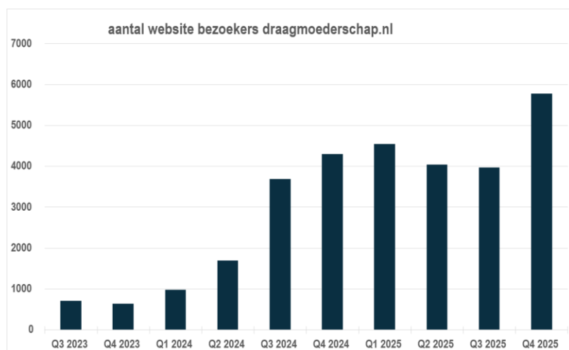
Figuur 1: Verloop van bezoekersaantal per kwartaal vanaf Q3 2023.

Om te zorgen dat zoveel mogelijk mensen toegang krijgen tot de juiste informatie is er continu gewerkt aan het vergroten van het bereik van draagmoederschap.nl. In de bovenstaande staafdiagram en tabel 7 wordt het verloop van het aantal bezoekers op draagmoederschap.nl weergegeven vanaf de lancering tot eind 2025.